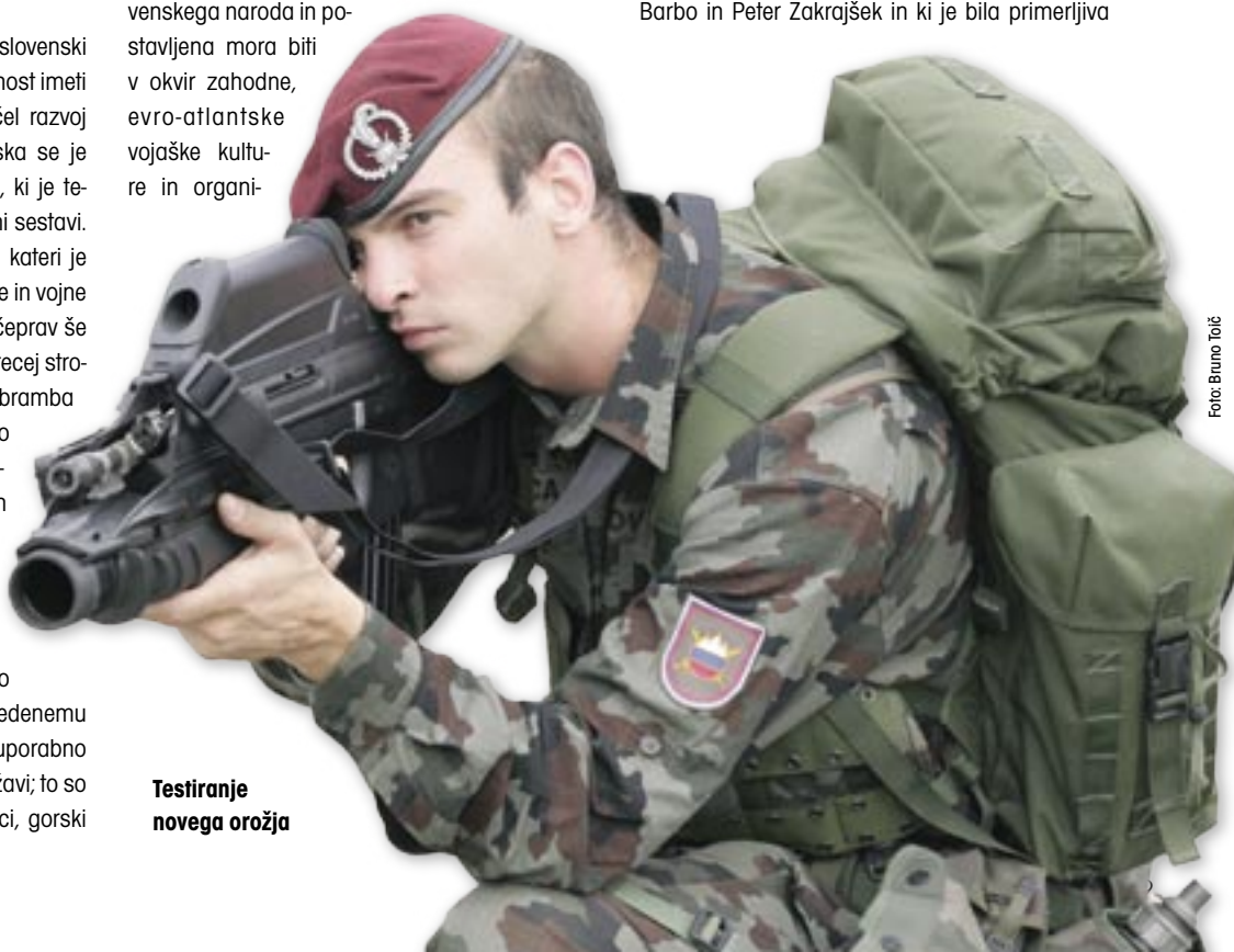
Testiranje novega orožja

zacije. To so obenem tudi načela, na katerih je začel nastajati 10. bataljon – pa kakršno koli ime smo mu že v zgodovini podelili. Danes, po desetih letih obstoja te enote je priložnost, da se izmeri njen vpliv in pomen tudi na razvojnem področju. Bataljonu je bila že s formiranjem na neki način podeljena tudi razvojna vloga. V njegovem poslanstvu je »utiranje poti« SV v mednarodnem vojaškem sodelovanju, bil je nosilec tako imenovanega procesa interoperabilnosti z Natom na taktični ravni, pomembno vlogo pa je imel in jo še ima tudi v procesu profesionalizacije SV. Seveda je treba tudi povedati, da bataljon v razvoju ni bil sam, trdne temelje na področju profesionalne vojaške kulture, odnosov in usposabljanja so postavili tudi v takratni 1. specialni brigadi MORiS ter v vodih STAS, kot smo imenovali vode profesionalne sestave. Veliko procesov in razvojnega dela je v SV potekalo vzporedno in na več ravneh. Mnogo je enot in poveljstev, ki v svojo zgodovino lahko zapišejo podobne uspehe. V nadaljevanju bomo navedli le nekaj področij, na katerih je bila izražena razvojna in inovativna vloga 10. bataljona. Morda bo zvenelo nenavadno, vendar je res: razvoj v bataljonu se je začel še pred nastankom enote. Ena najpomembnejših novosti je bila že prva formacija bataljona, ki so jo leta 1996 ustvarili takrat stotniki Josip Bostič, Miha Škerbinc Barbo in Peter Zakrajšek in ki je bila primerljiva