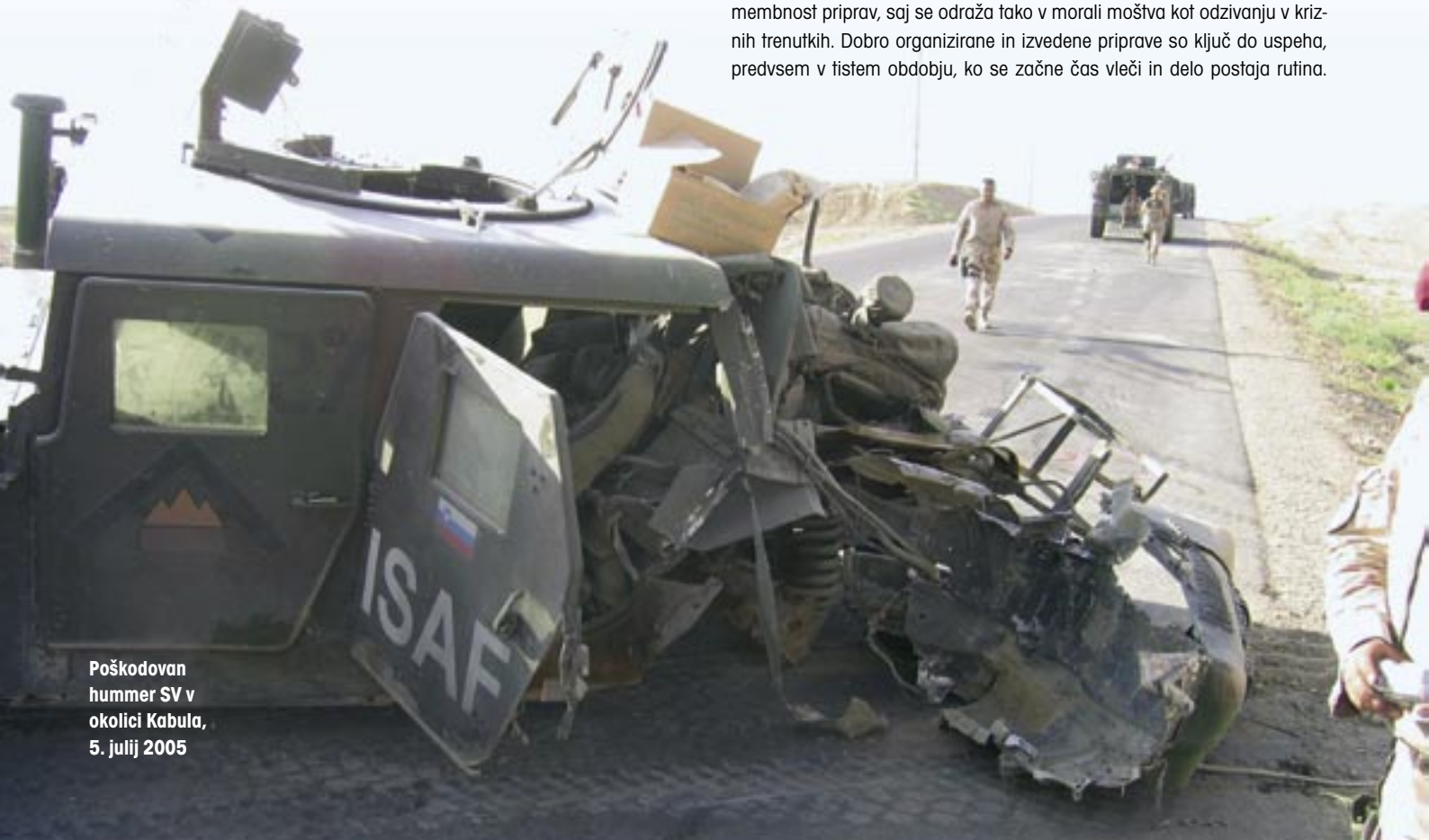
Poškodovan hummer SV v okolici Kabula, 5. julij 2005

Kot vsaka druga misija se je tudi ta začela s pripravami. Poudaril bi pomembnost priprav, saj se odraža tako v morali moštva kot odzivanju v kriznih trenutkih. Dobro organizirane in izvedene priprave so ključ do uspeha, predvsem v tistem obdobju, ko se začne čas vleči in delo postaja rutina.