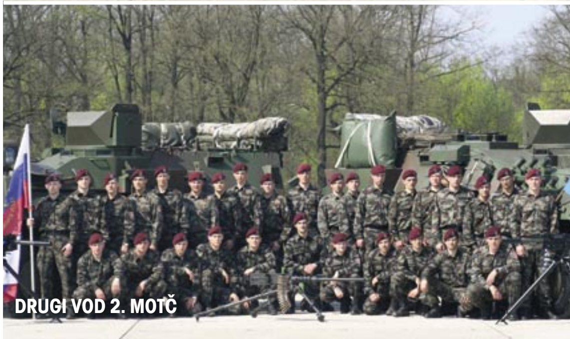
DRUGI VOD 2. MOTČ