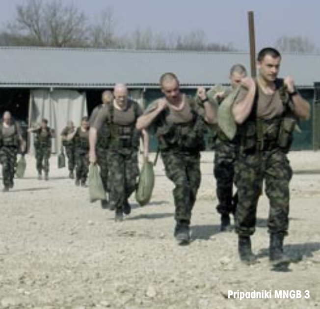
Pripadniki MNGB 3

spremembe, in enote so opravljale vedno več neznanih vojaških nalog. Od izvajanja patrolj, nadzorov sprtih strani ter nadzorov izvajanja vsebin daytonskega mirovnega sporazuma se je naloga vedno bolj nagibala k oblikam, za katere pehotna četa ni bila najprimernejši mehanizem. Stiki s predstavniki lokalnih skupnosti, mednarodnimi nevladnimi organizacijami in lokalnim prebivalstvom so zahtevali spretnosti in znanja, ki za vojaka pehote niso značilni. Zahtevno zbiranje informacij o domnevnih nelegalnih nahajališčih orožja pa je vendarle obrodilo sadove in vzpostavljene so bile možnosti za izvedbo naloge, kakršno bi si lahko le želeli.