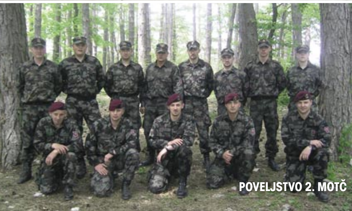
POVELJSTVO 2. MOTČ