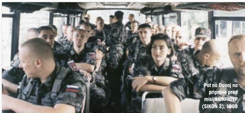
Pot na Dunaj na priprave pred misijo UNFICYP (SIKON 3), 1998

Kako mi je bataljon pomagal pri sedanjem delu? Veliko ali pa nič. Veliko v primerih, ko skušamo razumeti odločitev, ki je v nasprotju z drugimi, in veliko, ko je treba »zadhati« po bataljonsko, da bataljonu dopoveš, da morda le nima prav, in bi se zadeve dale urediti na drugačen način. Nič v