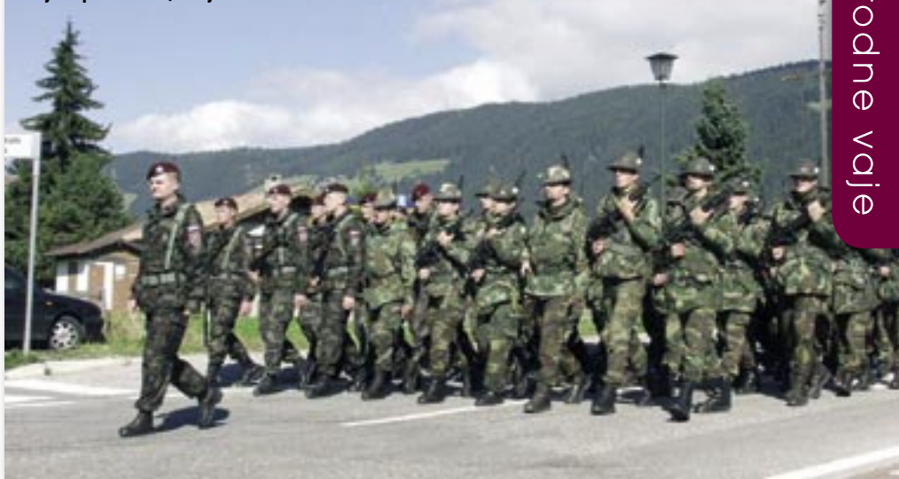
Vaja Esperia 2001, Italija

Mešana sestava čete in poveljstva bataljona je delovala zelo homogeno, manjše težave so se pojavljale le pri sporazumevanju, saj italijanski častnik za povezavo, ki nam je bil dodeljen v največji meri za prevajanje, ni najbolje obvladal angleščine. Pa vendar smo se z našo vedno uspešno improvizacijo in tudi s prizadevnostjo gostiteljev lotili vseh zadanih nalog in jih tudi uspešno izvedli.