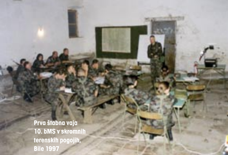
Prva štabna vaja 10. BMS v skromnih terenskih pogojih, Bile 1997

primerih, ko je bataljon res poseben in izjemen in ko že samo s priznanjem, da si bil pripadnik, izzoveš vznemirjenje.