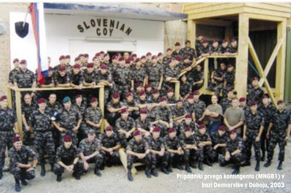
Pripadniki prvega kontingenta (MNGB1) v bazi Dennervike v Doboju, 2003

Med opravljanjem nalog MNBG 3 se je narava Sforja spreminjala. Stabilnost okolja je zahtevala