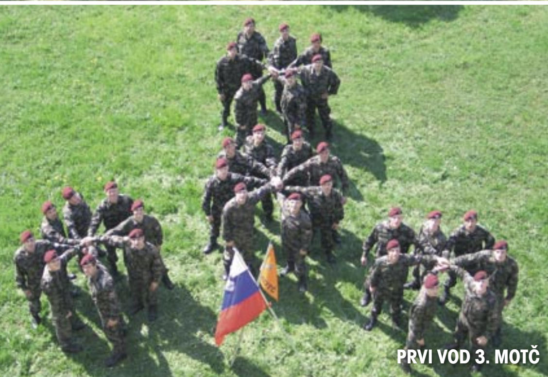
PRVI VOD 3. MOTČ