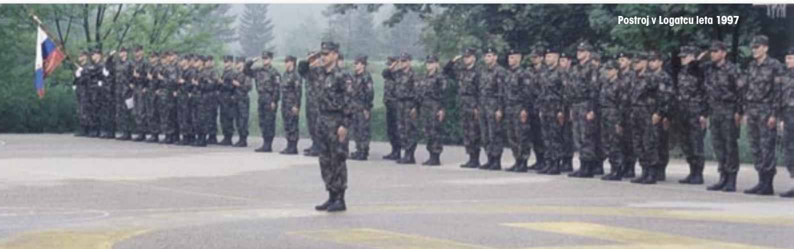
Postroj v Logatcu leta 1997

Na podlagi sklepa je načelnik GŠSV izdal odredbo, s katero nam je dal do tedaj verjetno najtežjo nalogo v naši vojaški karieri – v tednu