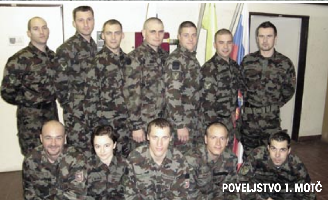
POVELJSTVO 1. MOTČ