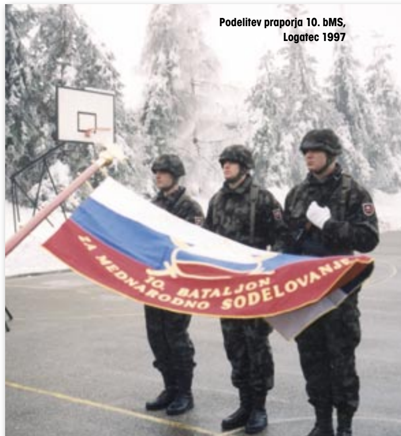
Podelitev praporja 10. bMS, Logatec 1997