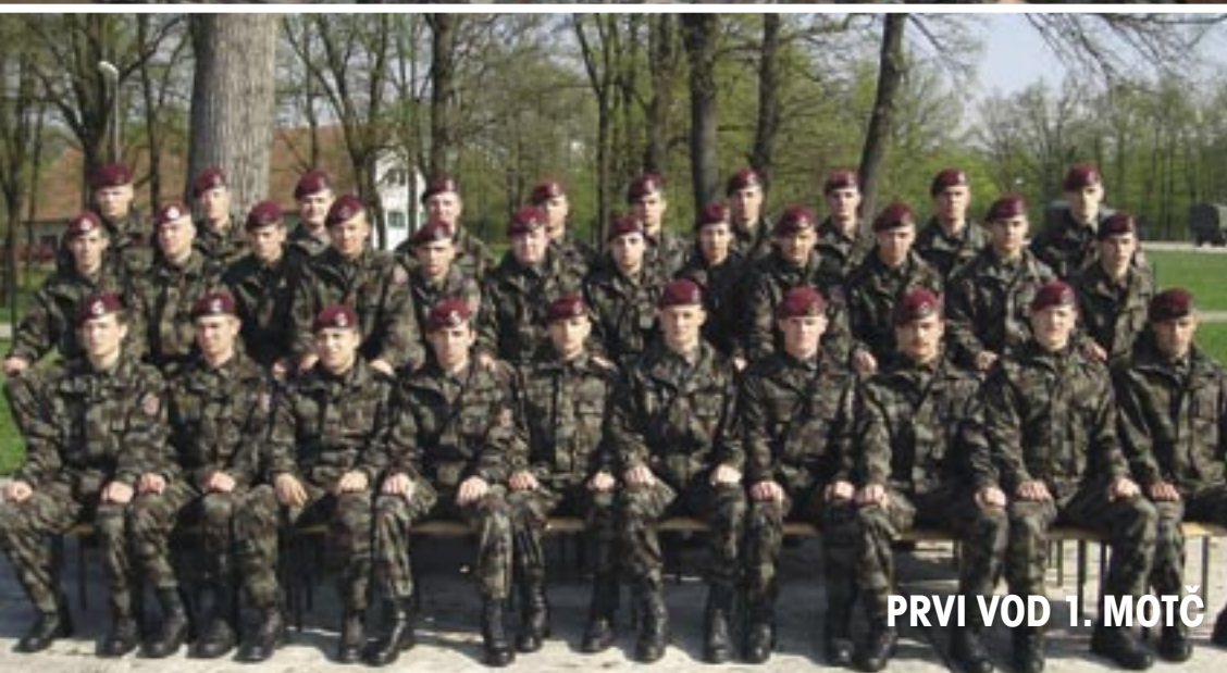
PRVI VOD 1. MOTČ