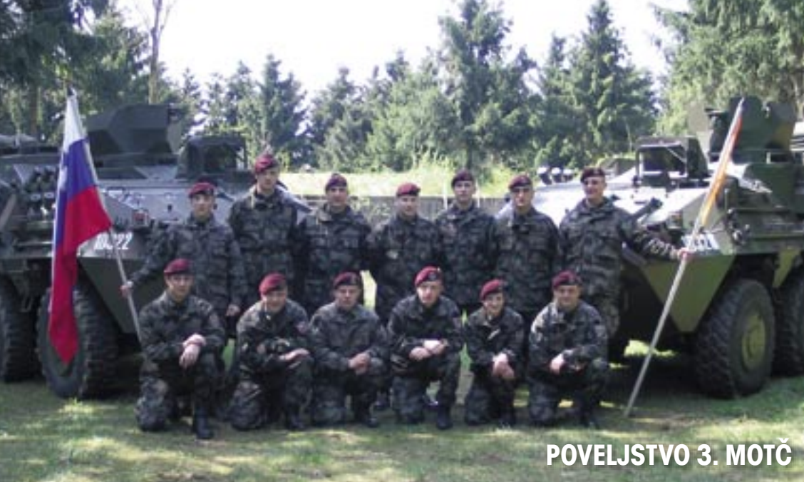
POVELJSTVO 3. MOTČ