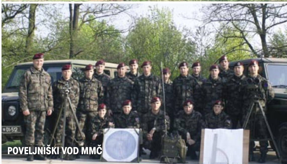
POVELJNIŠKI VOD MMČ