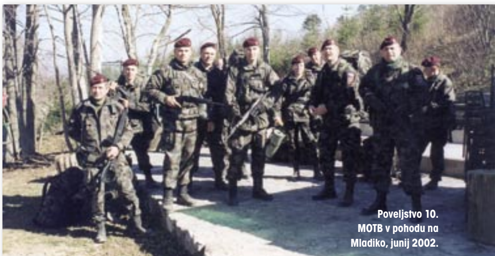
Poveljstvo 10. MOTB v pohodu na Mladiko, junij 2002.