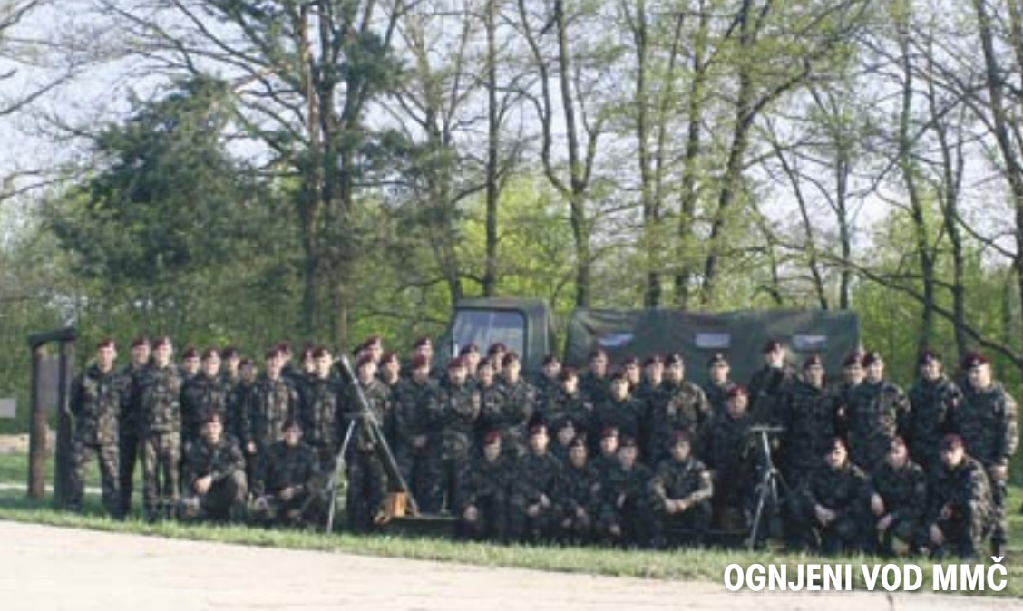
OGNIJENI VOD MMČ