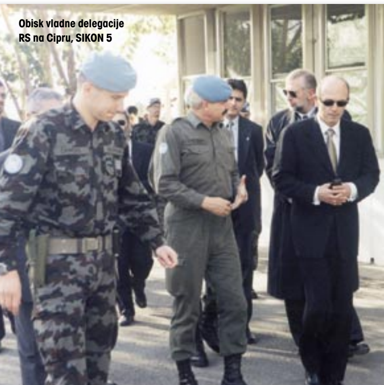
Obisk vladne delegacije RS na Cipru, SIKON 5