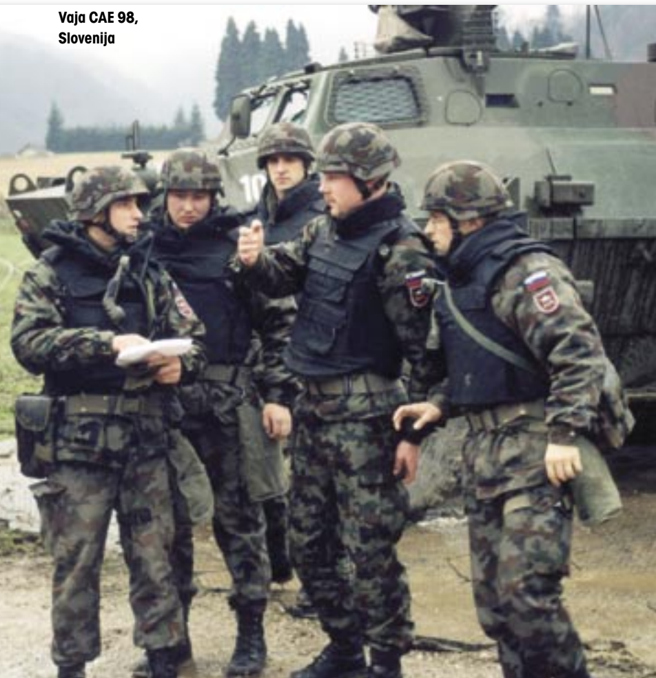
Vaja CAE 98, Slovenija