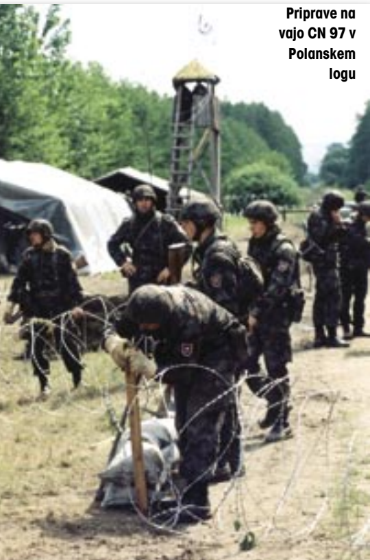
Priprave na vajo CN 97 v Polanskem logu

Razloge, da tak način preverjanja pri nas ni bil uveden, je pravzaprav mogoče iskati v vseh mogočih dejavnikih, dogodkih, načrtih in podobnem. Tak način dela se ni uveljavil, ker je bil v Sloveniji v času nastanka 10. bMS, torej v jeseni 1996, še naborniški sistem, pri katerem je bil način preverjanja povsem drugačen; ker je v SV tak način dela poznalo le malo pripadnikov (verjetno so o tem še največ vedeli v takratni brigadi MORIS oziroma ODS, ESD oziroma danes OIB, ti pa so delali v precej zaprtem krogu); ker takrat, ko je bila sprejeta odločitev o oblikovanju prvega poklicnega bataljona v SV, ni bilo vloženega dovolj napora v dejanske priprave