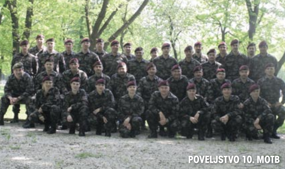
POVELJSTVO 10. MOTB